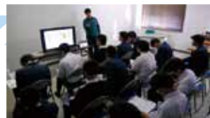
生産管理・記録のDX化の実例を学ぶ生徒

今後の活動計画にある、灌水制御装置や作業の記録・管理などの取り扱い方やフォーマットの項目立てなどに大変参考になりました。