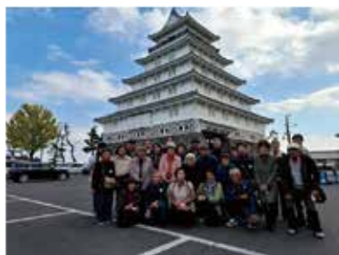
島原城で記念撮影

参加者からは「楽しい思い出ができた」「久しぶりの旅行でリフレッシュできた」「新しい友人ができてうれしい」との感想がありました。