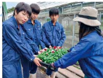
フラワーパークの職員に花苗を引き渡す生徒たち