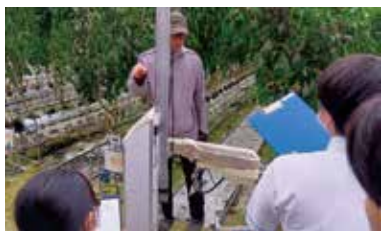
収穫ロボットの説明を聞く様子

本校は、令和7年度文部科学省「高等学校DX加速化推進事業」に採択され、園芸工学・農業経済科の取り組みとして、先進的農家等視察研修を行っています。