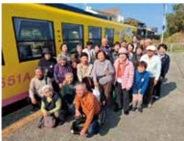
しまてつかフェトレインに乗り!

2日目は長崎カステラランドで買い物を楽しんだ後、貸し切り列車「しまてつかフェトレイン」に乗りしました。