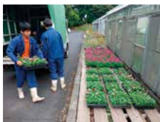
フラワーパークに花苗を降ろす様子

今後、イルミネーションも予定されているので、県内外多くの方々の目に触れることになります。自分たちが育てた花が、フラワーパークに来園される多くの方々に喜んでいただけると、今後の学習の意欲にもつながります。