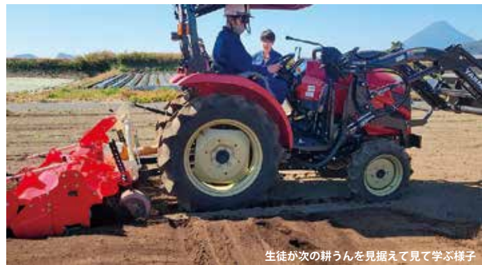
生徒が次の耕うんを見据えて見て学ぶ様子