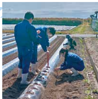
ジャガイモを植え付ける生徒

生徒たちはバレイショの特性や芽がでたつけ根部分には毒性が高いことなど、授業や実習を通して学びました。