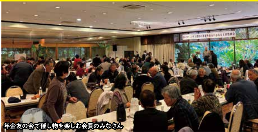
年金友の会で催し物を楽しむ会員のみなさん

令和6年度活動報告を行い、7年度活動計画などの議案が承認されました。また、懇親会では会員が楽しそうに食事を味わうなど、他の会員と交流する姿が見られました。