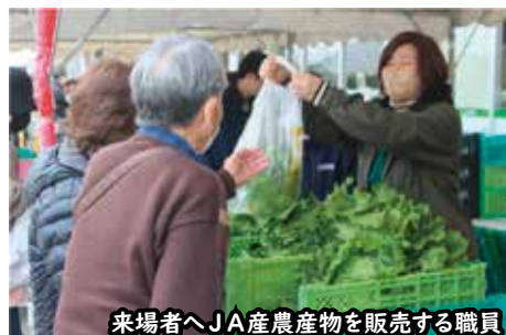
来場者へJA産農産物を販売する職員