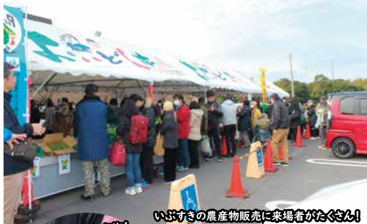
いぶすきの農産物販売に来場者がたくさん!