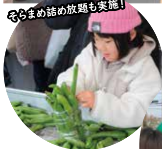
そらまめ詰め放題も実施!