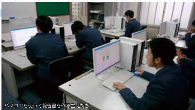
パソコンを使って報告書を作る生徒たち

生徒の中には、収穫の遅れでハクサイやダイコンが とう立ち 塔立したことから適期収穫の大切さに気づくなど、これからの学習に生かせる経験を得ることができました。