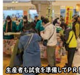
生産者も試食を準備してPR!