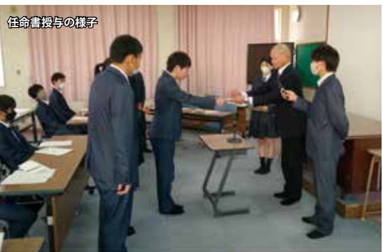
任命書授与の様子

新役員に選ばれた生徒たちにも新たな目線や取り組みを行い、活動しやすい雰囲気づくりなど今後の活躍が期待されています。