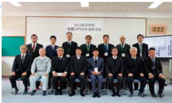
会に参加した生徒と学校関係者、来賓者ら

JAの福吉組合長は「学んだことをもとに地域を支える人材として頑張ってもらいたい。困ったことがあったときは、JAなど地域に相談できる窓口がたくさんあるので遠慮なく頼ってほしい。」と激励しました。