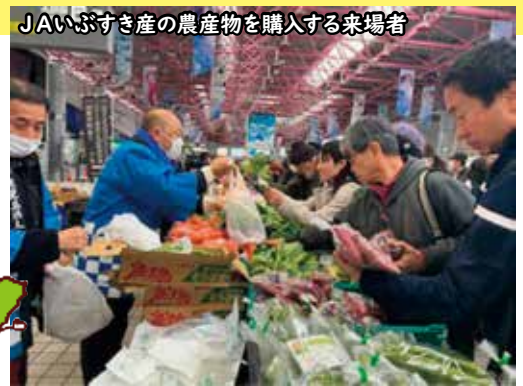
JAいぶすき産の農産物を購入する来場者