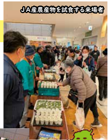
JA産農産物を試食する来場者