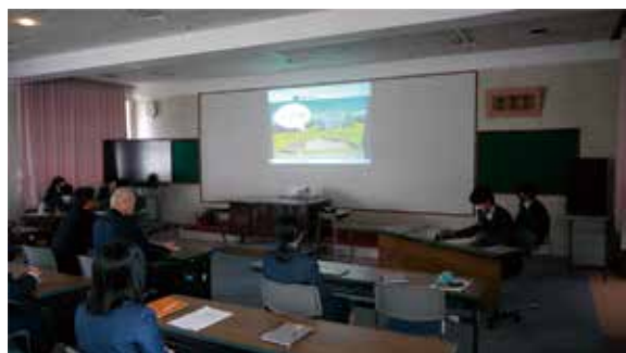
草花班による研究発表の様子