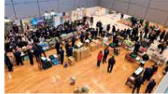
販売開始を待つ来場者