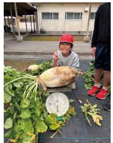
10キロ超の一番大きい大根を取りました!