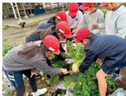
皆で力を合わせて収穫しました