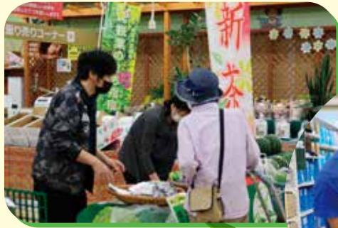
新茶の試飲販売も行いました