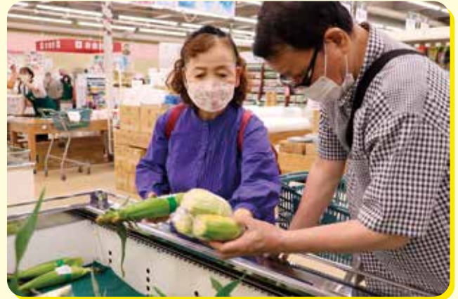
スイートコーンを購入する来店者

旬を迎えた徳光スイカや喜入産スイートコーンを販売しました。他にも、えい産新茶の試飲販売や国内産野菜の特売をおこないました。また、先着順にナスやシソの野菜苗を配布し開店直後に来店者が集まりました。