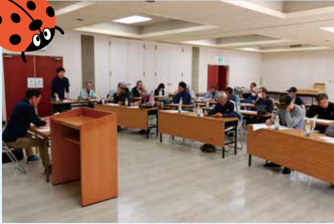
出荷規格を確認し合う生産者ら