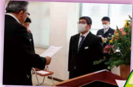
福吉組合長の激励を受けとる 新採用職員ら