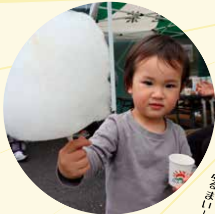
新茶試飲も綿あめ作りも大盛り上がり