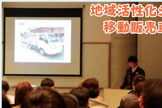
発表する JA 購買課の新留職員

鹿児島県は2月20日、地域活性化シンポジウム「語らんと！かごしま2024inいぶすき」を指宿市で開きました。JAとエコープ鹿児島は、買い物弱者の支援についてをテーマに、移動販売車「スーパーなのはな号」の活動を紹介しました。