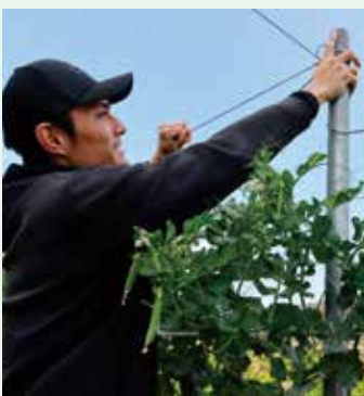
収穫も終盤となり片づけ準備をされていました。

A5. 「かっこよく美しく」農業をしたいです。理由は農業という仕事のイメージを変えて地元開聞の未来になげたいからです。後継者不足になる程、選ばれにくかった仕事の農業ですが、最近はおしゃれでかっこいい作業着が販売されるなど、少しずつ農業が選ばれる時代になりつつあると感じています。地元の子ども達から「あの人たちイケてるな」「農業しているんだ、イメージ新しいな」と思われるような変化を自分達の世代で起こさないといけないという思いがあり、よく一緒に農業をしている友人と話しています。入口は何でも良いと思います。「かっこいい」や「楽しそう」と思ってもらえさえすればいいですね。