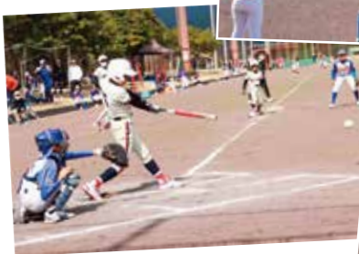
試合を行う選手ら