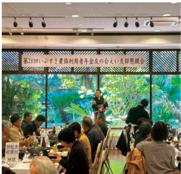
催し物を楽しむ年金友の会会員

J Aでは令和5年度の計画を面積82アール、1460トンの出荷で予定しています。