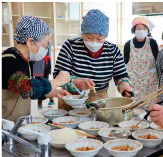
女性大学閉校式で調理する女性部員

J Aバンクで年金口座を開設すると、J A年金友の会にご入会いただけます。地域に合わせた活動・イベントで、新しい仲間や新たな楽しみが見つかります！他にも会員だけの特典がいっぱい！詳しくはお近くのJ A窓口へご相談ください。