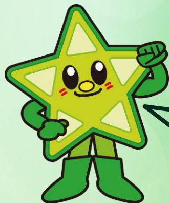
JAいぶすきイメージキャラクター 「オクラスター」

JAとはどんな組織だろう。 どんな仕事をしているのだろう。 身近なようで意外と知らないJAについて学 べる3日間です！