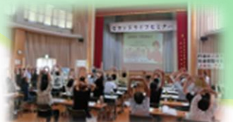
セカンドライフセミナー