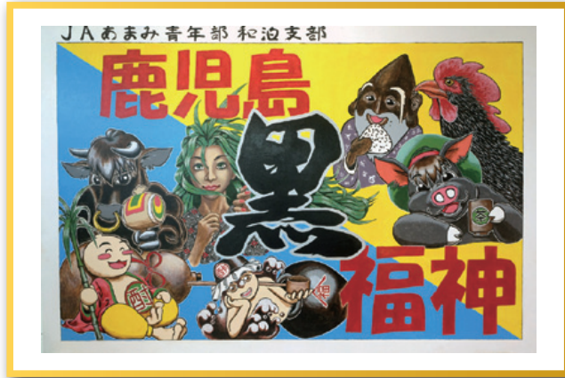
JAあまみ青年部 和泊支部

JA県青年部は、9月27日、鹿児島市のJA会館で第31回JA県青年大会を開き、同時に看板コンクールを行いました。 県内のJAから11点の応募があり、地元の特色を生かした、メッセージ性を盛り込んだ作品がそろいました。