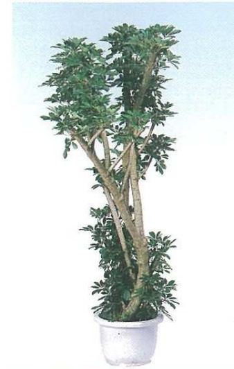
12 ホンコンカボック A F H