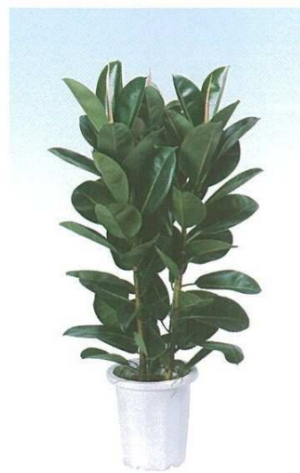
9 フィッカス ロブスター A E H