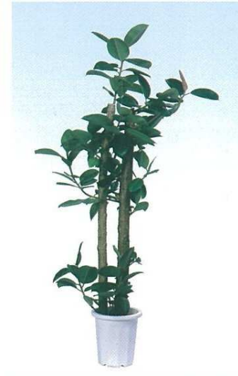
13 フィッカス ロブスター A F H