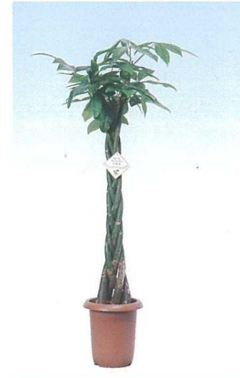
14 パキラ A E H