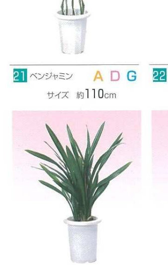
21 ベンジャミン A D G