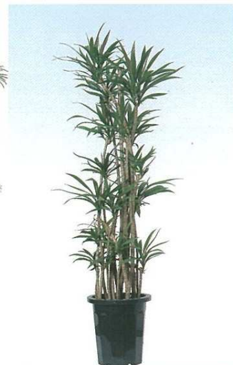
6 ドラセナグロークアル B F H