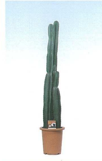
15 柱サボテン A F G