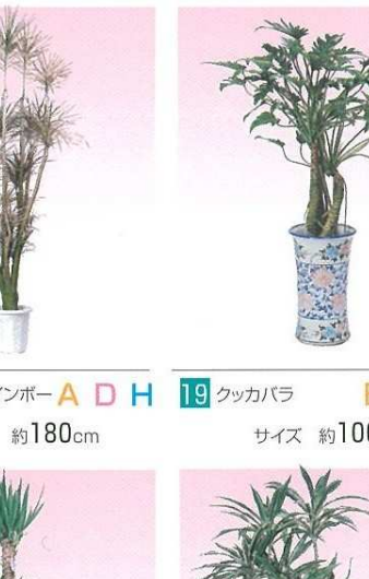
18 コンシナレインボー A D H