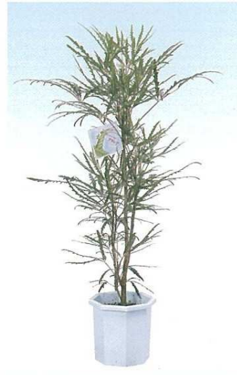
1 アラレア A F H