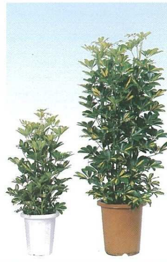
7 フィリホンコンカボック A F H