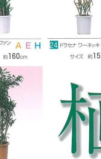
23 ユッカ・エレファン (ジャマイカ) A E H