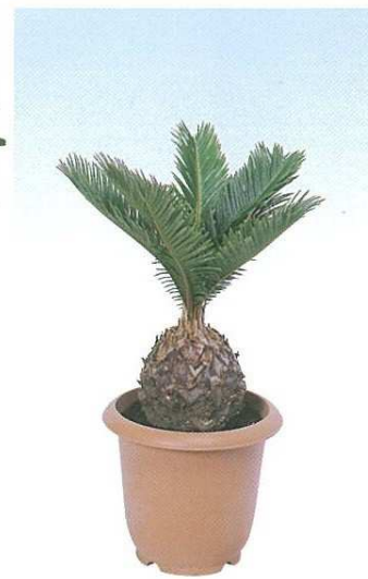
11 ソテツ A F H