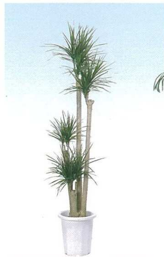
4 ドラセナマルギナータ (コンシンナ) A E H