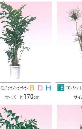
17 コモチクジャクヤシ B D H