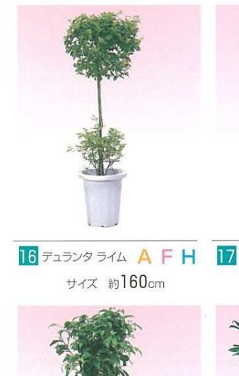
16 デュランタ ライム A F H