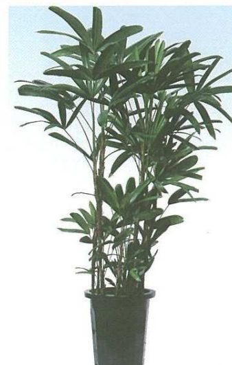
10 カンノンチク B F H