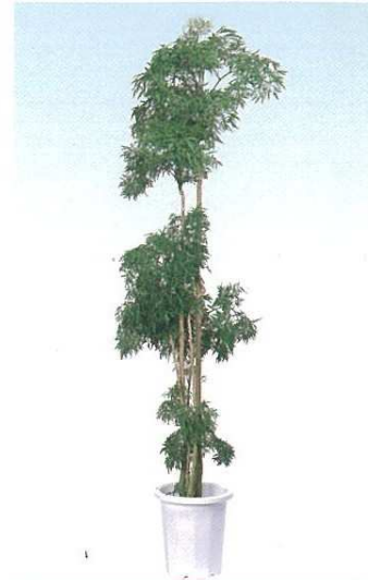
3 ホリシャス・フルチコーサ (台湾モミジ) A D H