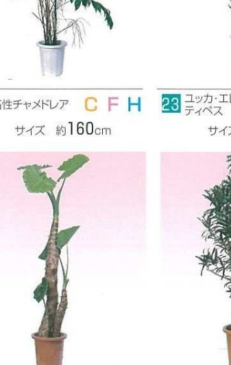
22 高性チャムドレア C F H