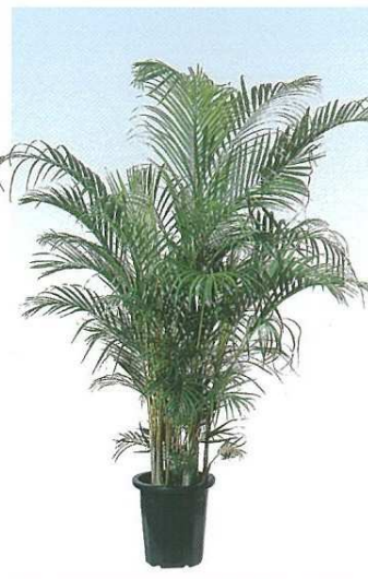
5 アレカヤシ B D H