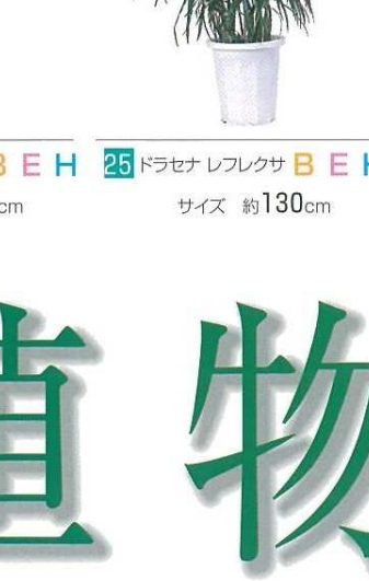
24 ドラセナ ワーネッキ B E H