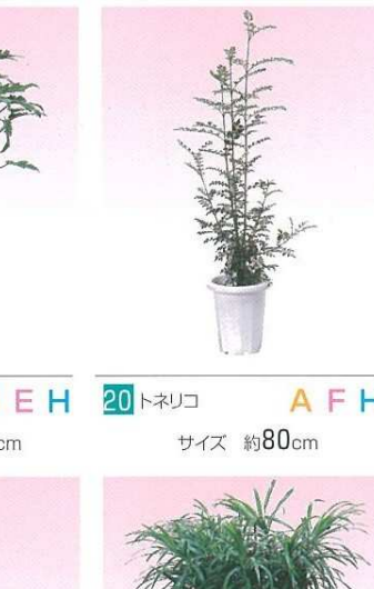
19 クッカバラ B E H