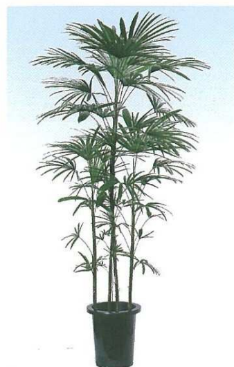
8 シュロチク B F H