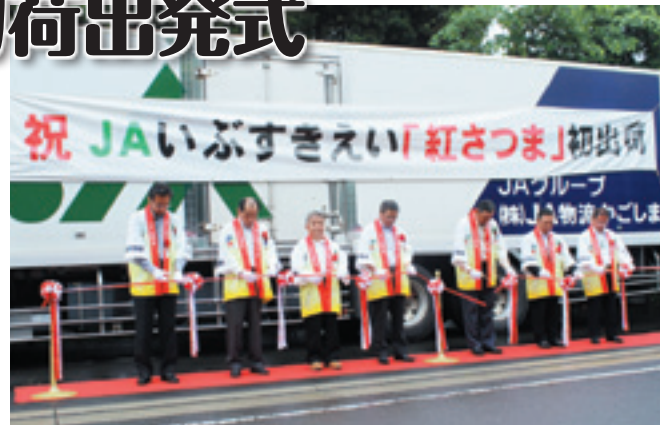
テープカットで初荷の出発を祝う関係者

JAえいさつまいも専門部は5月25日、南九州市頼娃町の釜蓋神社でえいもちゃん(品種ベニサツマ)の初荷出発式を開催しました。同部員・県・南九州市・JA関係者など約80人が参加、今年の豊作を願い神社へえいもちゃんを奉納し、名古屋・大阪方面へ向かう初荷のトラックを見送りました。かごしま