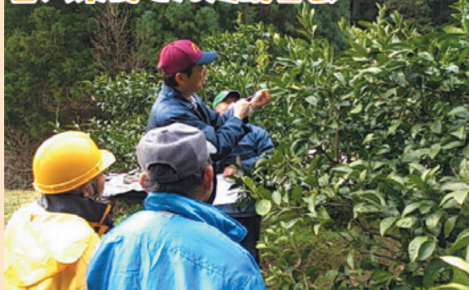
せん定のポイントについて学ぶ生産者

J A 喜入果樹部会は2月1～3日の3日間、鹿児島市で温州ミカンせん定講習会を開催しました。生産者・JAなど約20人が参加、寒波による被害で樹勢が落ちているため、事後の樹勢回復・病害虫対策・春に向けた施肥管理について学びました。講習後は現場でせん定のポイントについて日照や病害虫、管理のしやすさなど説明を受けながら学びました。担当営農指導員は「しっかりと作業を進め、より高品質なミカン生産につなげたい。」と話しました。