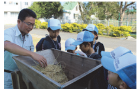
昨年のあぐりスクール