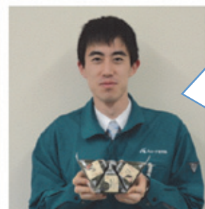
本社 武惣菜パイヤー