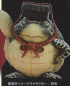
指宿市イメージキャラクター：砂吉