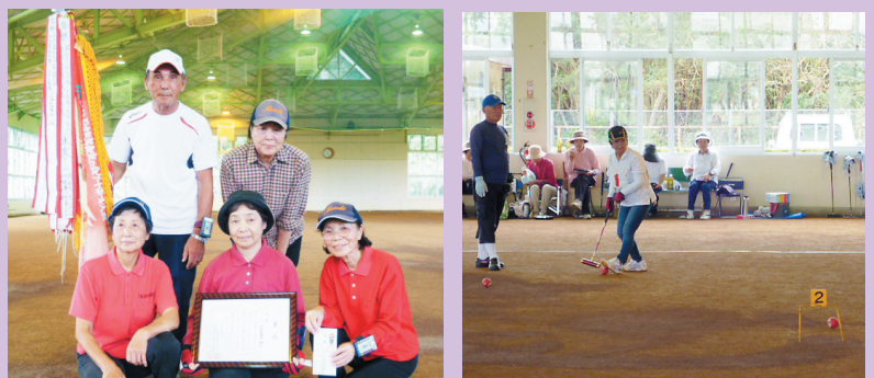
優勝したコスモスチーム