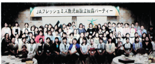
活動の内容はフェイスブック・LINE で、随時公開しています。「JA フレッシュユミズ鹿児島」で検索してください。

現在、会員は 8 0 0 人。「あそぶ・まなぶ・つながる」を合言葉に活動の輪、仲間の輪を広げていきます。