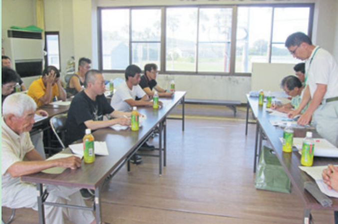
グリーンボール栽培について講習を受ける生産者

J A山川葉茎菜部会は7月8日、指宿市山川のJ A中央配送センターでグリーンボール栽培講習会を開催しました。部会生産者・J A・行政など18人が参加、品種試験の結果を検討、病害虫の防除ポイントについて説明を受け、品種ごとの植え付け時期を確認しました。山川地区では8月下旬ごろから植付けを開始、10月から出荷を計画しています。