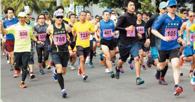
フル登山コースに参加したランナー

えい新茶・大野岳マラソン大会実行委員会は南九州市額娃町で第27回えい新茶・大野岳マラソン大会を開催しました。参加者は①フル登山コース（18km）・②さわやかコース（5km）・③らくらくコース（3km）の3種目で健脚を競いました。JAも青年部員や地区の職員が中心となり大会をサポートし、新茶の試飲販売、新鮮な農産物の販売を行いました。