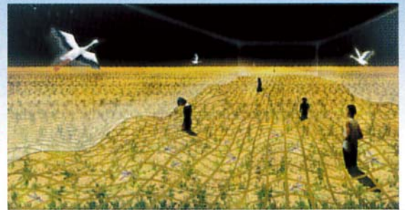
最新の映像技術で田園風景を再現 (イメージ)

日本館の展示は主に、①四季の田園風景を体感できる空間の再現②1,000を超える、食・農・食文化に関する画像の映写③地球的規模の課題解決のための日本の取り組みの展示④和食器などの伝統的工芸品とその精神を受け継ぐ現代日本の文化の紹介⑤未来のレストランを舞台にしたショー——の5つのコーナーに分かれています。最新の映像技術なども駆使し、日本が提起する「多様性」を体感できます。