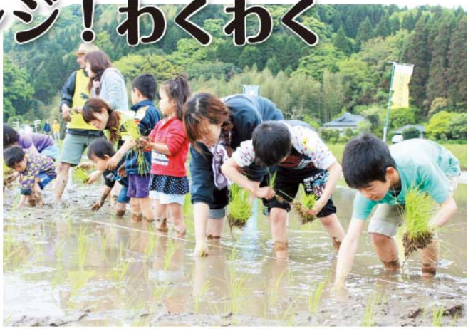
大人たちと田植えをする児童

公益社団法人指宿青年会議所は4月12日、鹿児島市喜入生見町で田植え体験学習を開催しました。農作業体験の少ない児童、子育て世代の親に体験の場を提供し、指宿市と鹿児島市喜入町の地域交流を深めることが目的です。指宿市内の小学生児童と鹿児島市立生見小学校の児童・保護者・地元住民など約130