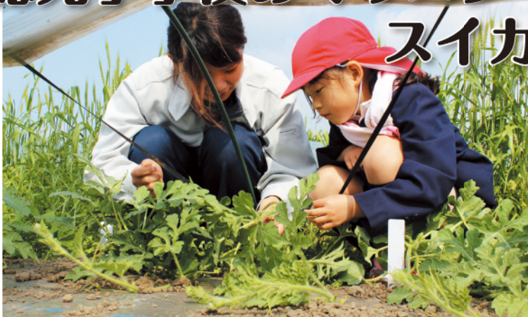
教わりながら丁寧に作業をする児童

JAは徳光小学校で開催しているめぐりスクールの第2回・3回目のスイカ栽培作業を4月14日・28日に開催しました。児童・先生・行政・市場関係者・JAなど約30人が参加、14日は整枝誘引作業（余分な脇芽や枝を取り除き、芽を同じ