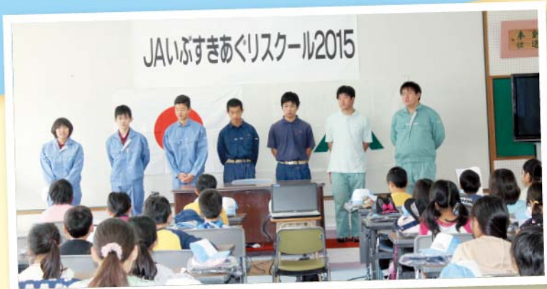
参加した山川高等学校の生徒