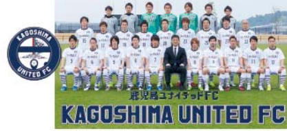
KAGOSHIMA UNITED FC 鹿児島ユナイテッドFC（プロサッカーチーム）

今後は、JAグループが主催する食農教育活動や清掃活動をはじめ、「ちびっこサッカー大会」や農業祭に選手を招くなど、タイアップしたイベント企画も積極的に行っていく予定です。各チームの試合日程については、HPに掲載されていますが、鹿児島ユナイテッドFCについてはJ3参入に向け、年間3万人以上の観客動員が必要です。