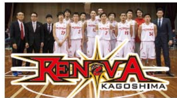
レノヴァ鹿児島（プロバスケットチーム）