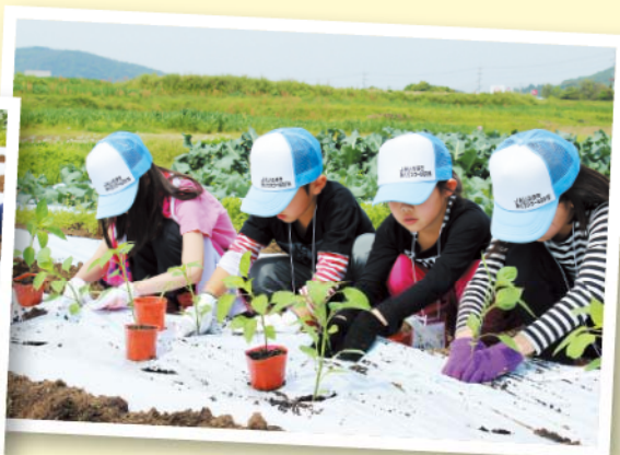
大人と一緒に種まき・苗植え