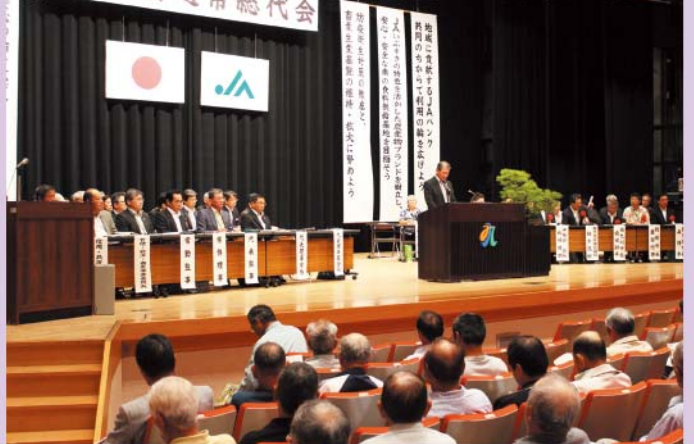
第21回通常総代会の様子

JAいぶすきは5月27日（水）、指宿市の指宿市民会館で第22回通常総代会を開催いたします。総代会は組合員の代表である総代の皆様が出席し、平成26年度の事業報告・平成27年度の事業計画などについて審議します。今年は役員改選の年で役員を選任についての議案も協議いたします。