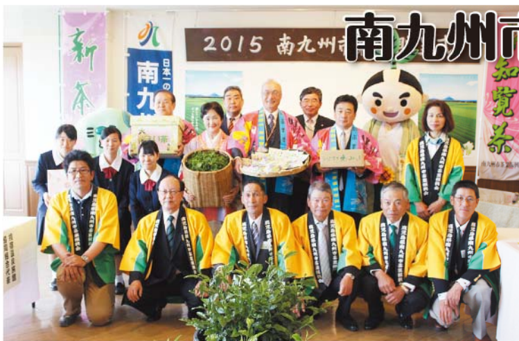
贈呈式に出席した関係者

南九州市茶業振興会は4月28日、指宿市の指宿ロイヤルホテルで新茶贈呈式を開催しました。南九州市の茶業関係者・指宿温泉旅館事業組合・JAなど約50人が出席、南九州市茶業振興会・南九州市・JAいぶすきなどが指宿市内のホテルやJA九州・指宿商業高等学