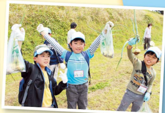
みんなでタマネギを収穫