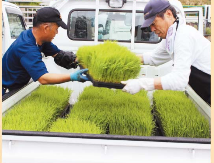
軽トラックに苗を積み込む職員

J A管内で3月下旬から4月上旬にかけて、早期水稲苗の配布を行いました。各地区の育苗センターなどでは、集まった生産者の軽トラックなどに次々と積み込みました。全体で約1万2千300箱、約61.5ヘクタール分の苗を配布しました。早期苗は8月中旬には収穫を予定しています。