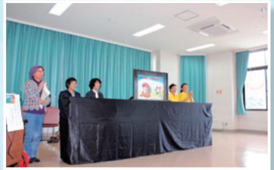
鹿児島弁で紙芝居「さるかに合戦」