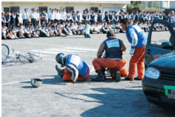
生徒が事故の危険性を体験した自転車交通安全教室

JAいぶすき、JA共済連鹿兒島は10月16日、指宿市立指宿商業高校で、生徒に交通ルールの順守を呼び掛けるため、自転車交通安全教室を開催しました。全校生徒約560人が参加、スタントマン