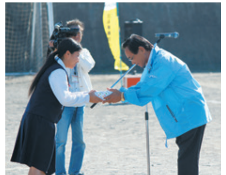
西迫常務（右）からJAより交通安全資材の贈呈

が目の前で危険な自転車走行（携帯電話で話しながら運転、蛇行運転、右側走行運転など）による交通事故場面をリアルに再現、生徒は事故の衝撃や怖さを実感しました。