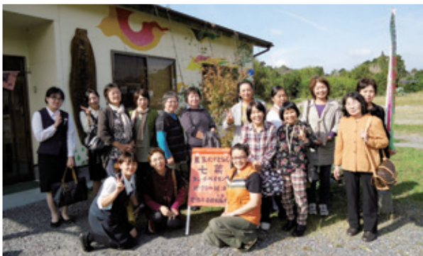
いちき串木野市方面への視察研修へ参加した部員・職員