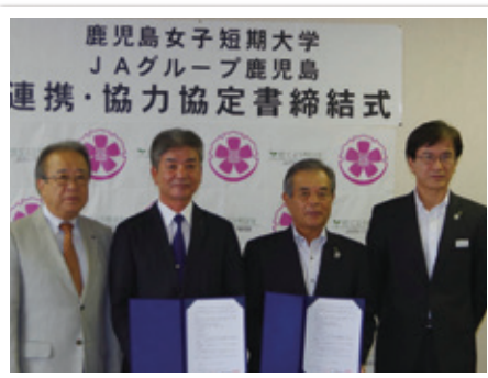
協定書を交わした久保中央会会長（右から2番目）と幾留学長（左から2番目）

9月19日に開催したJA女性部フレッシュミズ交流会では、託児ボランティアとして同短大の学生が参加しました。