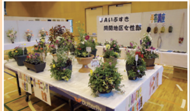
展示された開間地区女性部員の作品