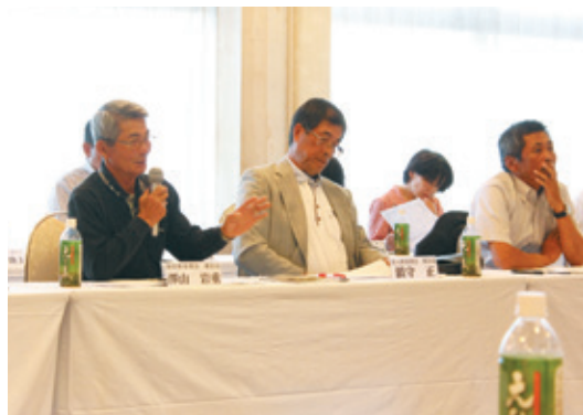
活発な意見交換の場となった語る会

JA野菜部会協議会は10月16日、指宿市内のホテルでJA常勤役員との語る会を開催、部会協議会役員・JA青年部・女性部・県連合会、JA役員など約40人が出席しました。意見要望について、購買・営農販売に関する内容が主となりました。JAは生産者への購買品の宣伝、情報提供の充実などの要望に対し、春夏作の主要品目であるオクラ、カボチャについて管内統一で注文書・カタログを作成、渉外担当も携帯し、金融店舗窓口にサンプルを展示するなど、店舗内外での対応を強化すると回答しました。