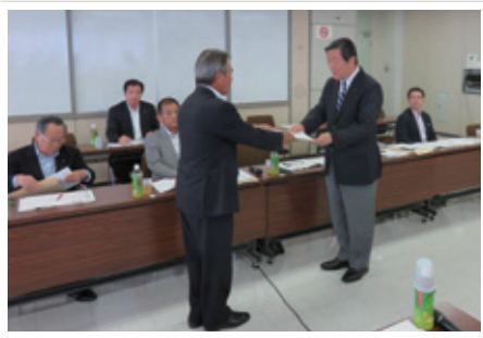
森山議員（右）に要請する久保中央会会長（左） （県選出国会議員との意見交換会時）

12月末の予算案の決定に向け、本県の提案内容が最大限反映されるよう、引き続き、農林水産省や県選出国会議員などへの働きかけを行います。