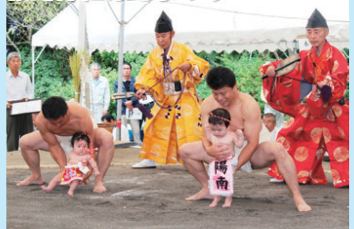
赤ちゃんの土俵入り

10月14日～16日にかけて、指宿市開聞の枚聞神社でほぜまつり(例大祭)が開催されました。16日は、子供たちが色鮮やかな衣装を着て町を歩く、稚児行列や相撲大会も開催されました。相撲大会では、小学生・中学生・高校生の迫力ある取り組みに、大勢の観客から声援が飛んでいました。また、赤ちゃんの健やかな成長を願って土俵入りも行われました。