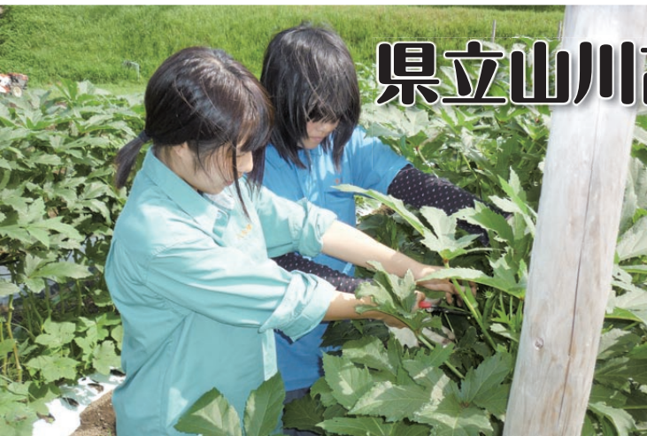
オクラ栽培に取り組んだ山川高校の生徒

県立山川高校では、初めて露地オクラの栽培に取り組んでいます。実えんどうの栽培を行った後のうねをそのまま利用し、省力化栽培で毎日収穫作業を行っています。担当の先生は「J A 指導員に指導を受けながら、初めて栽培に取り組んだ。最初は葉を落とすすぎたり、出荷規格が分からず苦労した。今年は台風や季節風も強く、児童も生産者の苦労が良く分かったと思う。」と話しました。