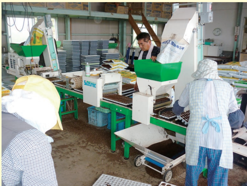
ピークを迎えた秋冬作のセル苗種まき

指宿市山川のJAいぶすき広域育苗センターで2014年産秋冬作セル苗の種まきがピークを迎えました。キャベツ類・レタスを中心に生産者から注文を受けた苗を生産していますが、ここ数年加工野菜を中心に、契約栽培面積の拡大から苗の注文数も増えています。本年は約4万トレー（面積では約100ヘクタール）の注文になる予定です。多い日には1日に1000トレー程度種まきをしました。担当者は「注文が多く、暑い中の作業は大変だが、生産者の所得につながる大事な苗作りなので、病害虫に気をつけながら期待に添える苗になるよう管理を行います。」と話しました。9月の苗生産をピークに、翌年の2月の春夏作のキャベツ苗まで生産される予定です。