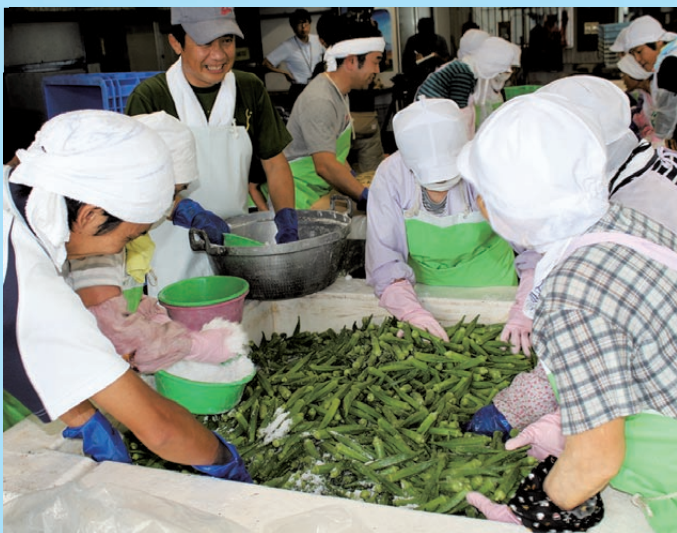
恒例となったオクラ漬け作業

8月15日、指宿市の農産加工組合でオクラの漬け込み作業が行われました。農産加工組合員・市・J A職員など約50人が参加、コンテナで運び込まれたオクラを丁寧に水洗いし、塩で漬け込みました。参加したJ A職員は「夏の恒例作業になっている。多くの人に日本一のオクラを味わって欲しい。」と話しました。