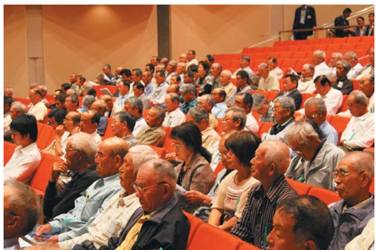
出席した総代の皆様