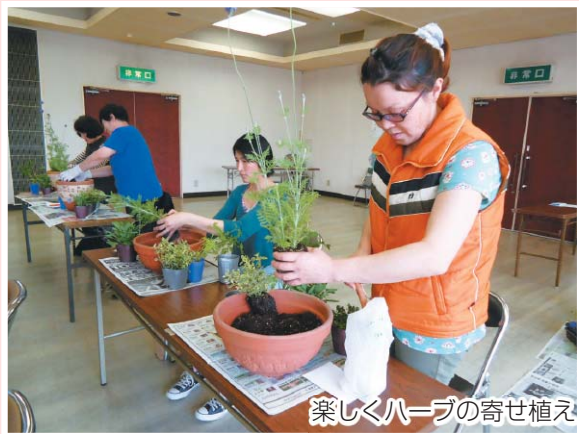
楽しくハーブの寄せ植え