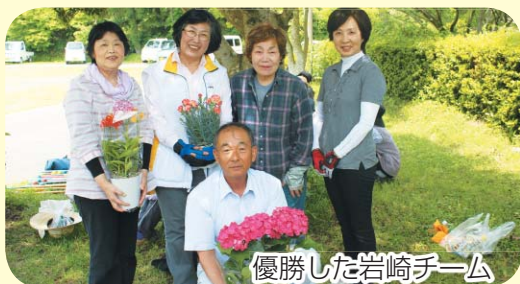
優勝した岩崎チーム