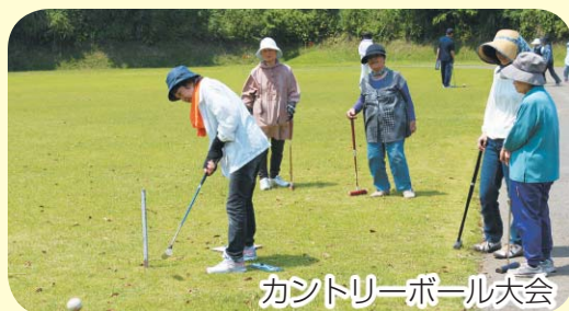
カントリーボール大会