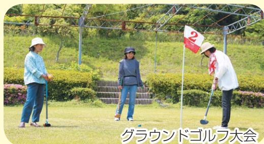
グラウンドゴルフ大会