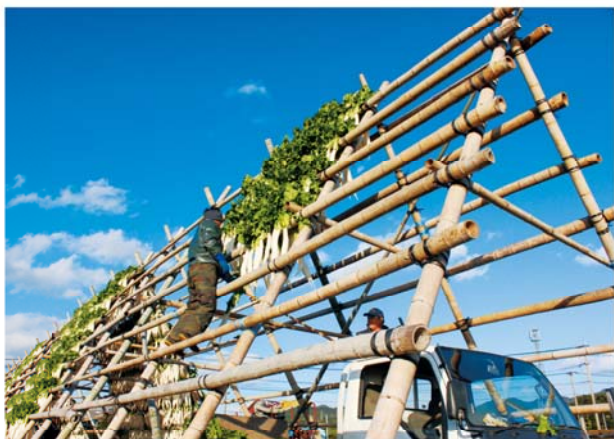
大根をやぐらにかける生産者

管内の南九州市頴娃町で干し大根の出荷が始まっています。生産者は、冬の風物詩となつている大きな大根やぐらにきれいに洗浄した大根を次々に棚がけていました。JAでは11月27日から12月6日にかけて南九州市頴娃町の各支所・集荷場で出荷目揃え会を開き、生産者へ今年の生育状況、今後の肥培管理の生育状況、今後の肥培管