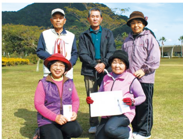
優勝した池田Bチーム