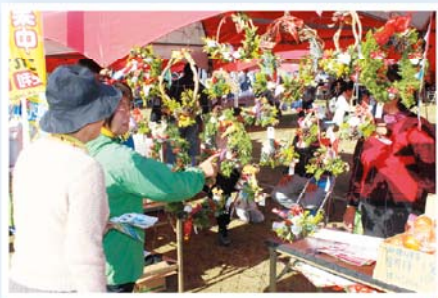
女性部の販売コーナー

また、前日の22日には地元の農産物品評会を開催しました。36名の生産者が108品の農産物を出品、市・J A担当者が審査し、当日の式典で表彰式を行い、即売会でセリに掛けられ、来場者に販売しました。