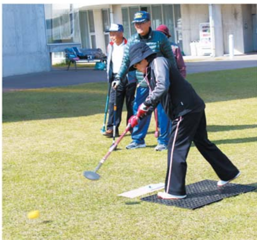
熱戦を繰り広げた参加者