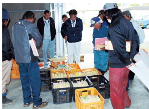
出荷目揃え会の様子

理、集出荷要領についてJA職員が説明し、生産者は集荷場に集められた干し大根を手に取り、状態を確認しました。担当指導員は「中規格中心での出荷を心がけ、生産者の所得向上を目指す。」と意気込みを語りました。11月下旬から2月上旬まで出荷が行われ、JAでは共販面積24ヘクタール、数量500トン、金額6400万円を計画しており、干し大根は鹿児島くみあい食品など食品会社3社に出荷されます。