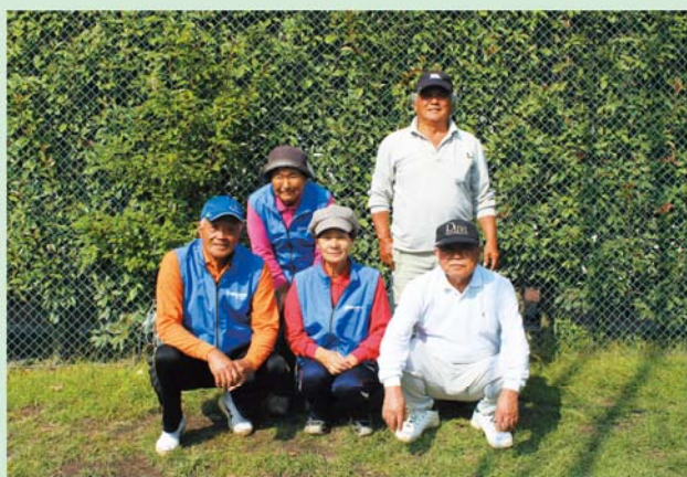
山川チームの皆様

第17回鹿児島県農協利用者年金友の会グラウンドゴルフ大会が11月7日に鹿児島ふれあいスポーツランドで開催されました。競技は、県内各地の予選を勝ち抜いた15JA60チームの間で熱戦が繰り広げられました。当JA管内からは3チームが参加し、団体の部で山川チームが9位に入りました。