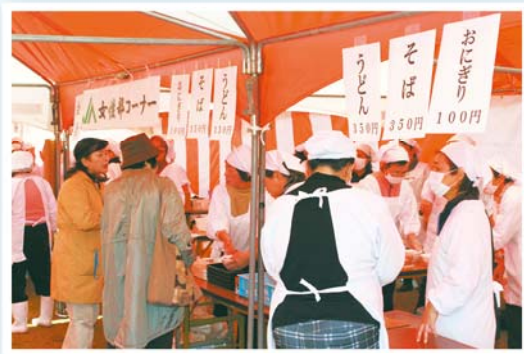
女性部の野外レストラン