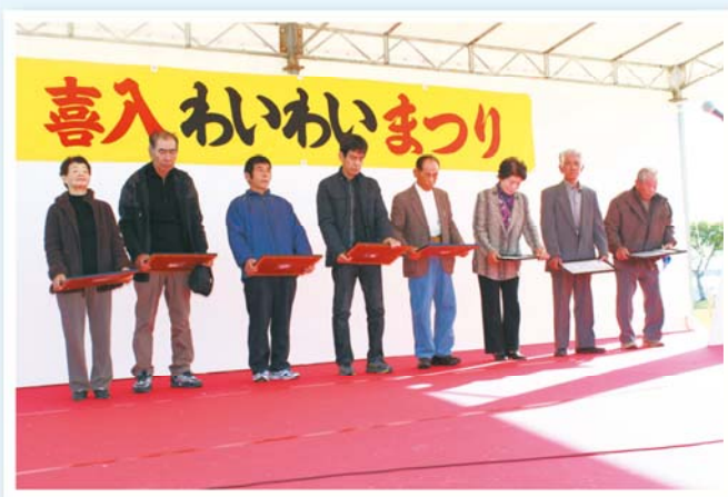
品評会「金賞」受賞者の皆様