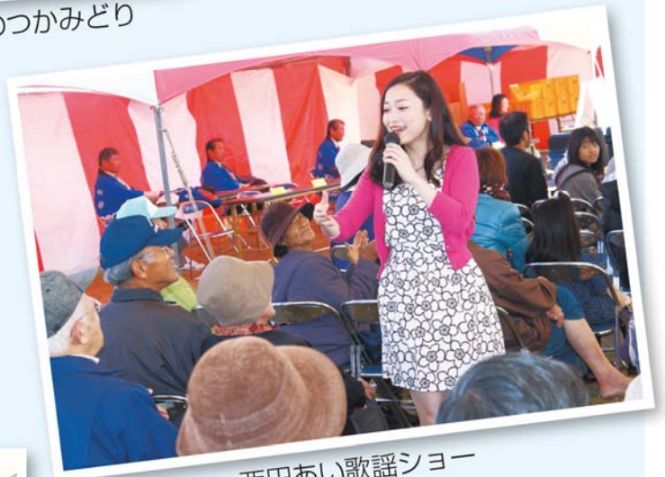
西田あい歌謡ショー