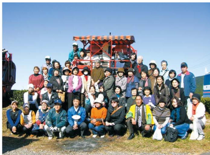
ツアー参加者の皆様

また、鹿児島茶業界が一体となり「お茶一杯の日」に県内消費者が緑茶に親しむ感謝フェアを各地で開き、JAいぶすき茶業センターでは、南九州市穎娃町内と第28回喜入わいわいまつり、鹿児島中央駅前のアミューズ広場でお茶の販売を行いました。