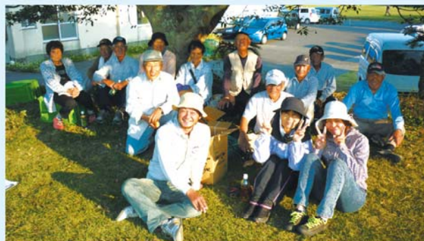
部会員と家族の皆様

JA 山川すいか部会は、2013年度の反省会・交流会を10月29日に開催しました。交流会には、部会員、JA 職員など20名が集まり、グラウンドゴルフを行いました。反省会では、今年の販売について県経済連、鹿児島中央青果が説明、JA が実績について報告しました。今年は徳光小学生の生徒が、あぐりスクールで栽培から販売まで行い、各報道機関でも取り上げられたこともあり、昨年より単価も高く、出荷数量170 t、2680万円の実績でした。