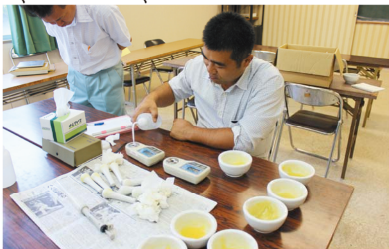
糖度を確認する検査員

管内の穎娃地区で栽培されている同品種は、収穫してから40日間の貯蔵を徹底しており、12度以上の「べにはるか」を「えい太くん」として出荷しています。甘みが非常に強いことで注目を集めており、JAでは糖度を維持するために、出荷が始まってから毎月1回、抜き打ちで検査を実施し、糖度が基準に達しなかったものは「えい太くん」としては出荷せず、高糖度での出荷にこだわっています。