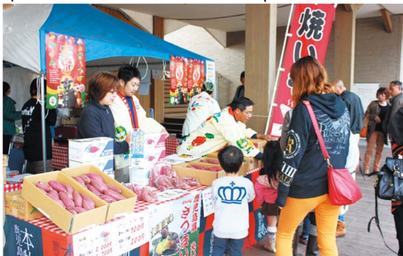
多くの来場者が訪れたフェア会場

J A いぶすきは、かごしまブランド品目であるえいのさつまいもの店頭販売を行い、紅さつま「えいもちゃん」、紅はるか「えい太くん」の5 キ ・2 キ の箱売り・500 グ の袋売りの他に、紅はるか焼き芋の販売、紅さつまは「かりかり揚げ」として試食品の提供を行いました。焼き芋も試食した来場者は「甘くて、しっとりしていてとてもおいしい。」と喜んでいました。その他、「かごしま茶」・「志布志のピーマン」・「東申良のきゅうり」・「安納いも」の販売・試食も行われ、かごしまブランド品目を多くの方にも知ってもらおう良い機会となりました。