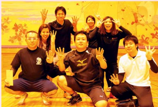
優勝した昇りゅうチーム

JAは11月8日、指宿市の開聞総合体育館サブアリーナで、職員サークルミニバレーボール大会を開催し、6チームが参加しました。予選は2組・3チームずつに分けて行われ、熱戦を繰り広げました。