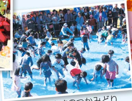
うなぎ・ますのつかみどり