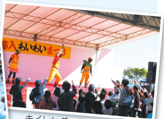
キイレンダーとじゃんけん大会