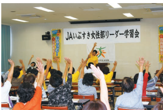
学習会前に行われた「レインボー体操」