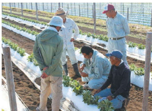
今後の管理作業について確認する生産者