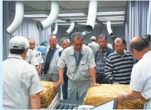
葉たばこの品質を確認する生産者

10月中旬、管内各地区の生産者が宮崎県都市のJTリーフセンターへ葉たばこを納めました。生産者が1年間、大切に育てたたばこをJT（日本たばこ産業）が品質を確認し、買取り価格を決める日で、会場は緊張した様子でしたが、総販売代金は、指宿総代区生産者15名で約1億7216万円、えい総代区生産者15名で約2億580万円の実績で、1kg当りの代金は前年を上回りました。