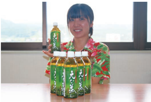
リニューアルした「えい茶ペットボトル」