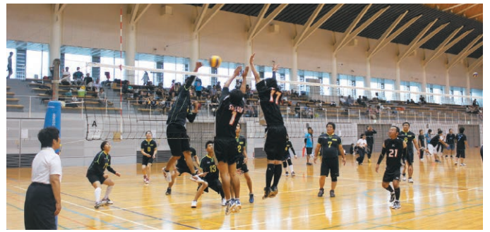
熱戦を繰り広げたバレーボール大会