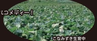
こなみずき生育中