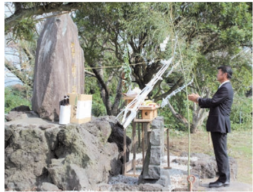
畜魂碑に祈る関係者

J A・畜産部会会議は11月1日、「2013年度畜魂祭ならびに研修会」を指宿市の指宿中央家畜市場・開聞農村環境改善センターで開催し、管内畜産農家や関係団体など約200名が参加しました。参加者は、家畜への感謝と鎮魂の意をこめて神事を執り行いました。神事後は、指宿市役所健康増進課による「『健幸』