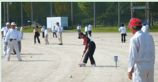
熱戦を繰り広げたゲートボール大会

第37回鹿児島県農協利用者年金友の会ゲートボール大会が10月10日、鹿児島市中山町のふれあいスポーツランドで開催されました。JA いぶすきからも第42回 JA いぶすき年金友の会秋季大会の上位4チームが参加し、熱戦を繰り広げました。