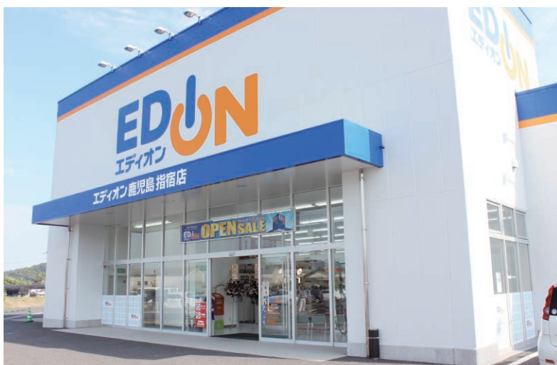
エディオン鹿児島指宿店

J A いぶすきと業務提携しているエディオン鹿児島指宿店が10月25日、旧ベスト電器指宿店跡地にオープンしました。J A いぶすきは2008年からベスト電器指宿店と業務提携を続けていきましたが、今回ベスト電器からエディオンへ看板を替え、リニューアルオープンしました。J A は今後も催事等を含めて積極的な取り組みをしていく予定です。