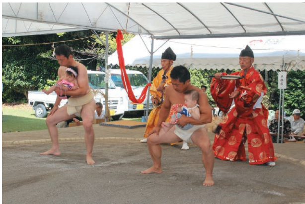
赤ちゃんの土俵入り

ほぜとは「豊饒」と書き、大地の恵みにより農作物が良くできることを意味し、一年間、心を込めて育てた作物が実りを結ぶ季節に、収穫の喜びを分かち合い、感謝をささげます。