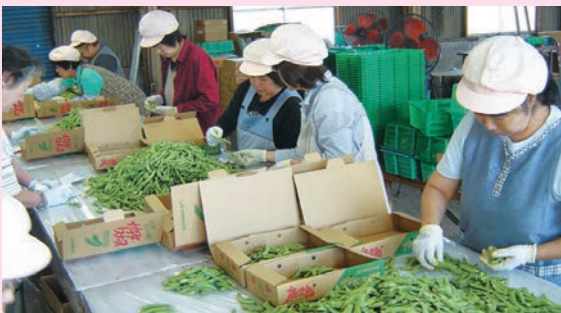
出荷の始まったスナップえんどう

スナップえんどうの出荷が、10月17日より始まりました。播種以降の高温少雨、また例年以上にヨトウガ類が多発し、生育に苦慮していますが、生産者の管理努力により出荷につながっています。担当指導員は「子どもに人気で食べやすいスナップえんどうの需要を掘り下げ、生産量を拡大していきたい。」と話しました。JAでは、管内で、5月上旬ごろまでの出荷を見込んでおり、本年度共販計画を面積70ヘクタール、911トンの出荷量を見込んでいます。