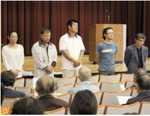
功労者の披露も行われた研修会

への取り組みについて」と題して研修会が行われ、指宿市における健康増進の取り組みと自宅でも簡単にできる健康体操の紹介があり、参加者は和やかな雰囲気の中でのびのびと体を動かしていました。また、畜産事業に多大な業績を残した功労者の披露も行われました。