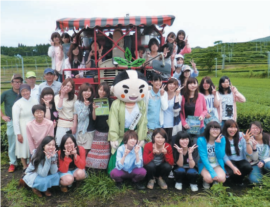
女子大学生がお茶について研修

6月3日、鹿児島純心女子大学看護栄養学部健康栄養学科の学生32名が、JA茶業センターを訪れ、お茶について研修を行いました。午前中は、二番茶製造中のクリンティイかごしまで工場見学・茶畑での乗用型摘採機の試乗体験を行い、午後からは頼娃町の水土利館にてお茶の手揉み体験・お茶の歴史・お茶の淹れ方などを学びました。学生は「お茶の製造過程を見れたことや摘採機の試乗等、本当に貴重な体験が出来ました。」と話しました。