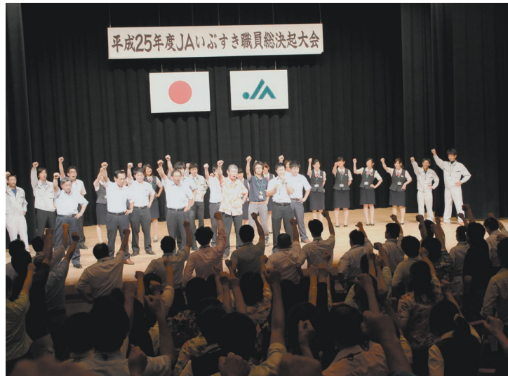
全員が事業目標の達成を誓った総決起大会

6月27日、南九州市の穎娃文化会館で平成25年度職員総決起大会を開催しました。職員約370名が参加し、本年度の事業目標達成に向けて全員で取り組むことを確認しました。