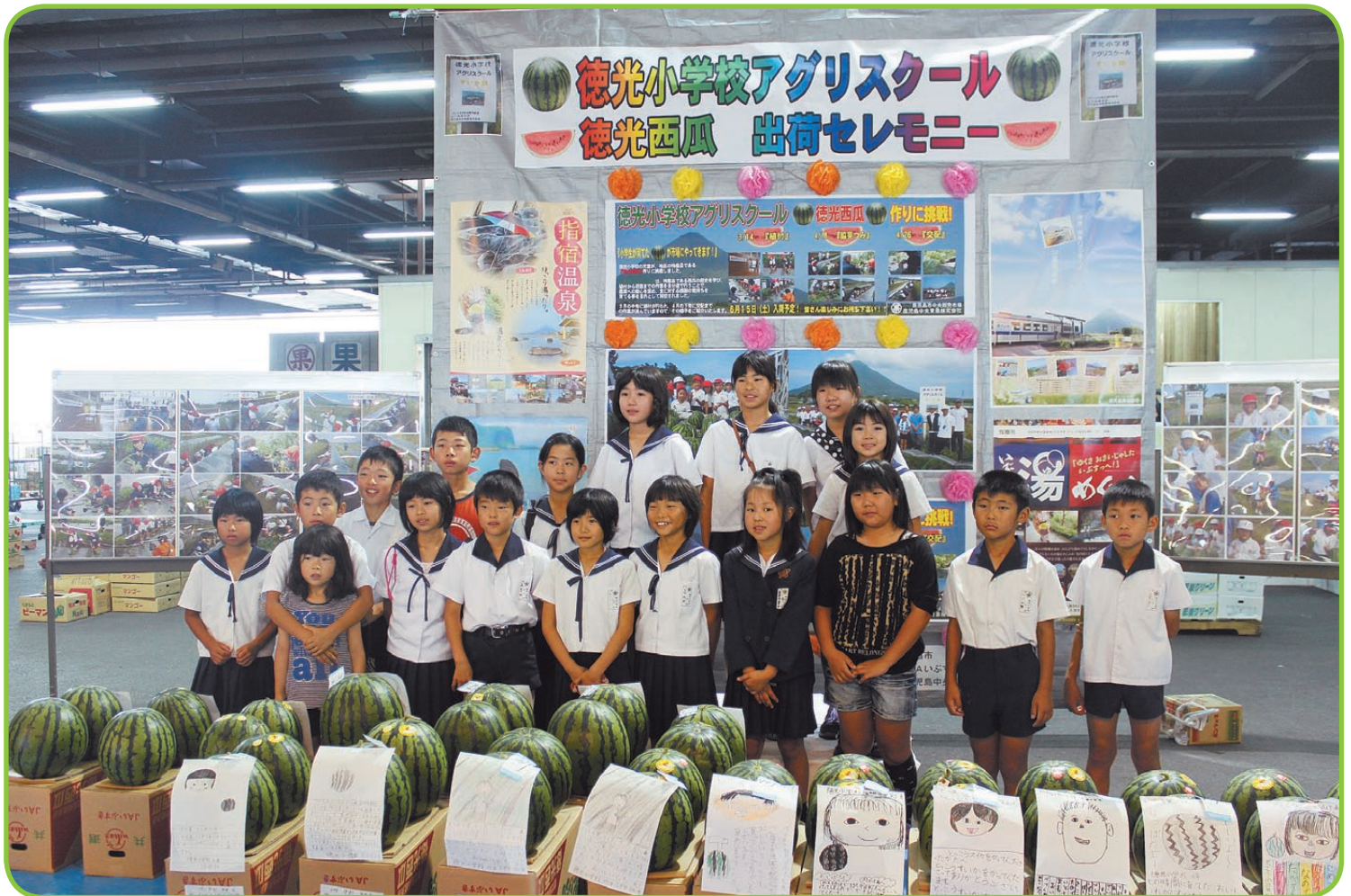
徳光小学校 (3・4年生) あぐりスクール市場体験 (6月15日 鹿児島市中央卸売市場で)