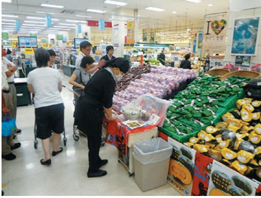
JAいぶすき産の農産物が販売された店内

フェアでは、鹿児島島の農産物のPRイベント・販売が行われ、JAいぶすき産の春かぼちゃ・オクラ・さつまいもを中心に販売を行い、さらに