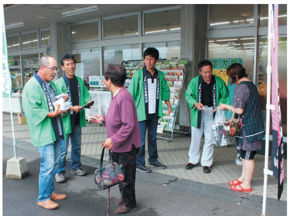
TPP参加反対のチラシを配る青年部員

JA青年部は6月15日、穎娃町のAコープえい店でTPP（環太平洋連携協定）への参加による国内への悪影響を訴えるチラシを配布し、TPP参加断固反対を来店者に呼びかけました。この日はJA全国青年部協議会が、全国一斉にTPP参加反対を訴える活動を展開しました。青年部員・JA役員は、国民、地域の仕事や生活がどう変わり影響を与えるのかを解説したチラシとポケットティッシュを配布しながら、参加反対を訴えました。