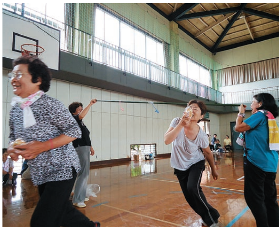
ミニ運動会の様子

J A えい地区女性部は6月27日、健康づくり・ミニ運動会を額娃トレニングセンターで開催し、女性部員・役職員など約70名が参加しました。参加者はチーム毎に分かれて、二人三脚・障害物競走・綱引きなどを行い、交流を深めました。女性部員は「疲れたが、運動不足解消のためにも良かった。」と話しました。お楽しみ抽選会も行われ、大いに賑わっていました。