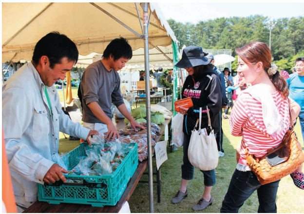
農産物の販売も行われた会場内