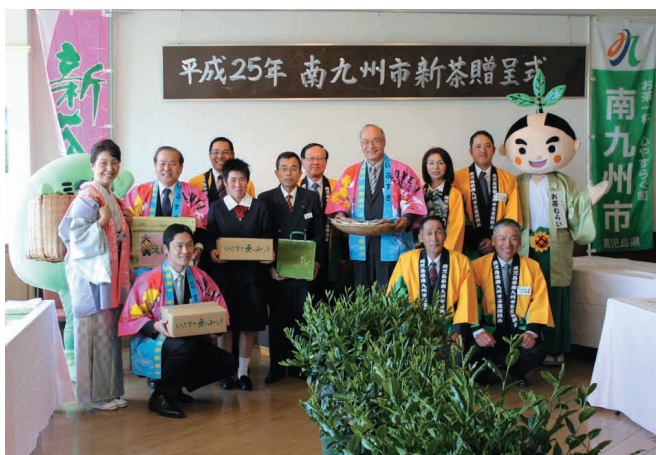
新茶贈呈式の様子