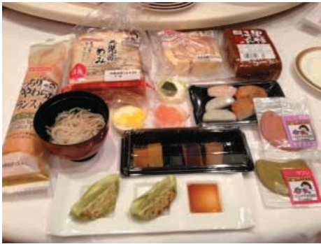
「こなみずき」を使った商品

発表会には生産者・開発メーカー・流通関係者・J A 役員など約 140 名が参加、「こなみずき」のもちもち・プルプルとした食感を生かした、約 15 種類の商品を試食しました。開発商品には「こなみずき」使用の統一認証マークを表示し、A コープ鹿児島・イオン九州株・株南九州ファミリーマーケットなどで販売します。