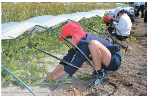
交配作業を行う児童