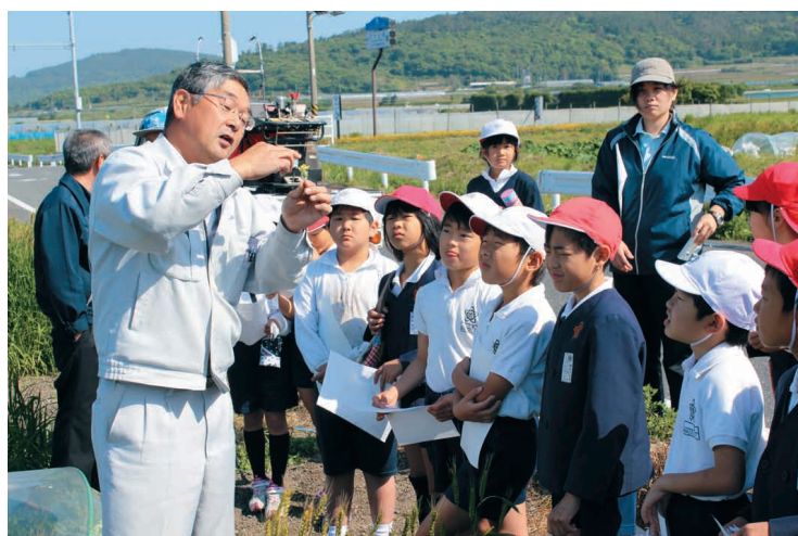
花粉の付け方を教わる児童