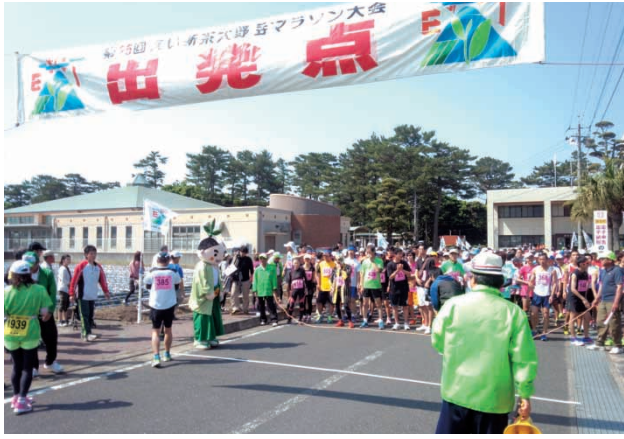
フル登山コース出発前の様子

穎娃運動公園から大野岳まで往復するフル登山コースでは、沿道でランナーに激励と共に特産のお茶が振舞われ、お茶畑の新緑が美しいコースで健脚を競いました。