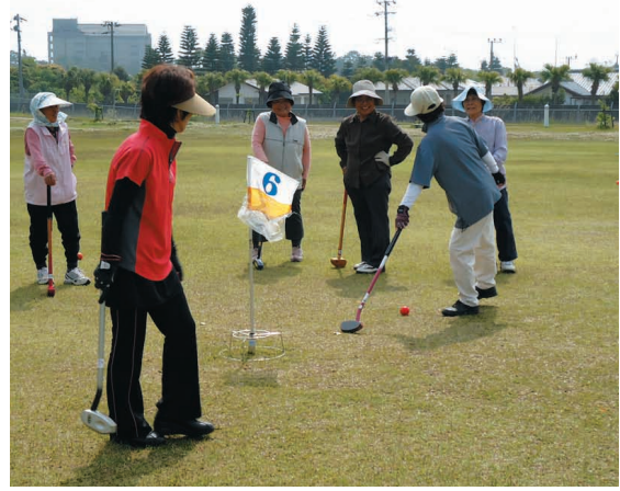
指宿地区女性部つどい・グラウンドゴルフ大会

J A 女性部は 4 月 19 日、指宿市のなのはな館で親睦と健康増進を図るため、指宿地区女性部つどい・グラウンドゴルフ大会を開催しました。指宿地区女性部員・J A 役員など約 100 名が参加、プレーが始まると真剣さが伺え、ファインプレイとともに歓声が上がるとともに盛り上がり、交流を深めました。