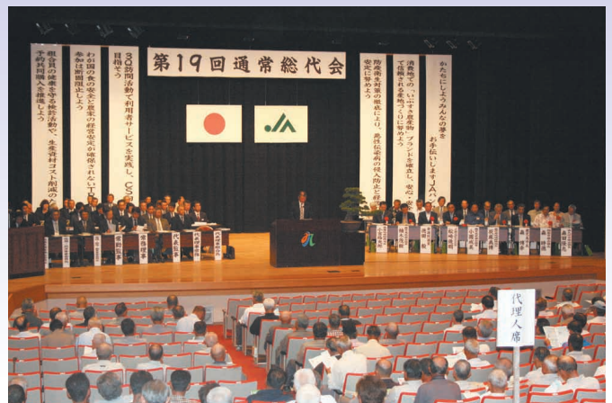
昨年の第19回通常総代会の様子

当初固定期間終了後も、固定変動選択型(いずれかの固定金利)を選択すると、その時点のJA所定の基準金利から最大4.0%金利を軽減いたします。金利は毎月見直しいたします。(金融情勢等の変化によっては、途中で見直しをさせていただく場合があります)お申込み時が実行時のいずれか低い方の金利が適用されます。固定金利を選択する期間終了(通常、5年・10年・15年)のお入札期には変更しません。お申し出により固定金利期間終了時に再度、その時点のJA所定の固定金利の特別を設定することができます。お申し出がない場合には、戻金金利型に切替えとなります。