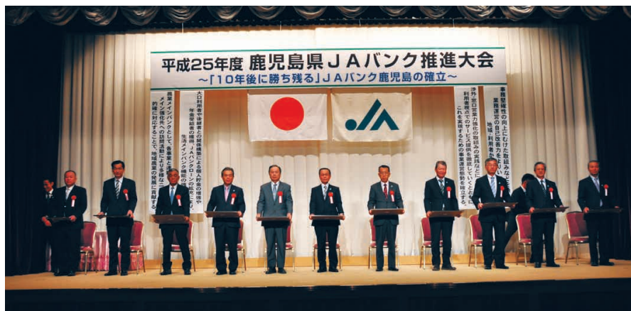
表彰を受けた各JA代表者