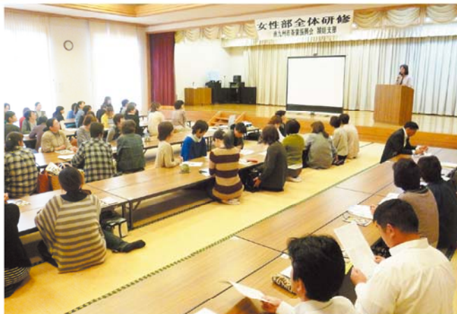
茶業女性部全体研修会

を共有し、女性後継者の親睦を深めるために組織再編を行い、新しい体制での女性のつながりを作り、お茶だけではなく子育て相談や仲間作りの場にもなつて欲しいとの考えで研修が行われました。