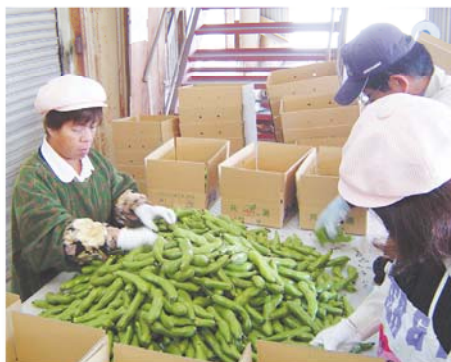
出荷の始まったそろまめ