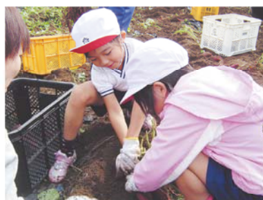
いもの収穫を行う児童

J Aから提供された紅さつまいもの苗を、5月に子供たちが植付けを行い、今回、約800kgが収穫され、児童たちは自分達が植えたいもの大収穫に大喜びしていました。