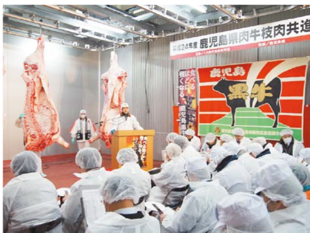
熱気に溢れた会場の様子

6円（同60円増）、売上額が133万2121円（同2万386円増）となりました。