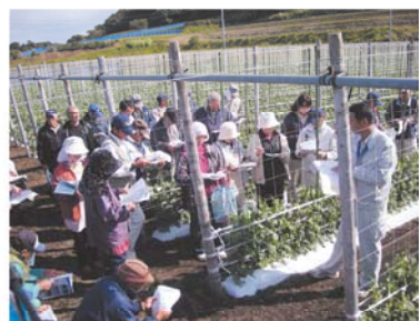
肥培管理、病害対策について確認をする生産者

山川地区では11月中旬からスナツプエンドウ、12月に入ると実えんどうの出荷も始まり、生産者、J Aともに活気づいて来ます。出荷は4月まで続く予定です。