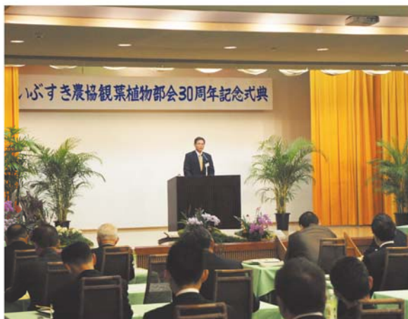
挨拶する下温湯部会長