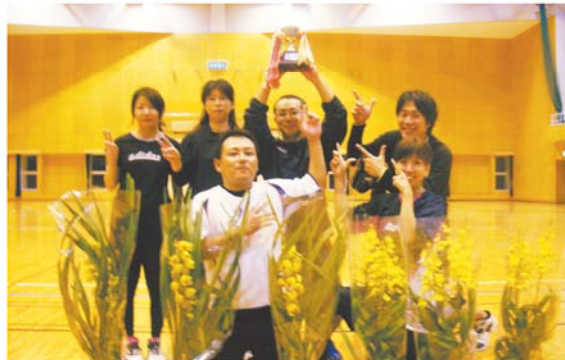
優勝したのぼりりゅうチーム

JA女性部は、10月26日、指宿市開聞総合体育館でミニバレーボール大会を開催し、女性部員、組合員、職員など多数のチームが参加し、熱戦を繰り広げました。 大会結果は以下の通りです。