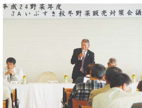
秋冬野菜販売対策会議開催

会議では、計画数量・金額および生育状況について報告後、①増収対策、②有利販売対策、③低コスト対策、④販促事業の強化を基本方針として販売を行うっていくことを確認しました。