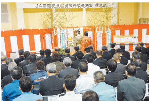
JA南薩拠点霜出澱粉工場落成式

工場は、南薩地域の甘しょ生産基盤の充実と生産振興に資することを目的とし、3JA（いぶすき・南さつま・さつま日置）が南薩甘しょでん粉協同事業体として運営します。すでに昨年9月25日から操業を開始し、12月19日まででん粉を製造しました。