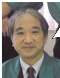
えい店 木之下店長

今年も満足のいくお買物、より充実した暮らしのお手伝いができるよう、従業員一同努めて参ります。