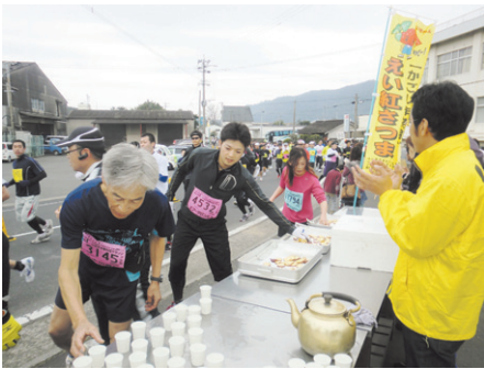
いぶすき菜の花マラソン

大会には約2000名のボランティアも参加し、当JAも各地区の生産者・女性部・農産部職員などが中心となり、コース沿いで地元の特産品である実えんどう・そらまめのスープや油で揚げたさつまいもなどを差し入れ、出場者を激励しました。温かいスープやさつまいもを手にとった出場者は疲れを癒し、それぞれのペースでゴールを目指していました。