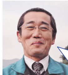
青戸店 二之宮店長

今年も地域の皆様のご意見・ご要望を取り入れ、便利なお店として、従業員一同お待ちしております。