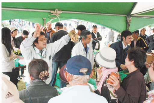
喜入わいわいまつり

このまつりは鹿児島市喜入地域の農林水産業、商工会の振興と消費者の交流に貢献する祭りとして毎年開催されています。