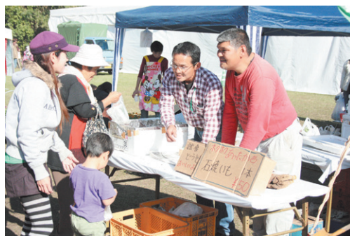
いぶすき産業まつり

会場では当JA関係者も出店し、牛肉、やきいも、お茶の試食・試飲販売、観葉植物や野菜、花の即売会など様々な店が軒を連ねて大勢の来場者で賑わっていました。訪れた人々にとって、指宿市の農林水産業や商工業など、全ての産業を知る良い機会となりました。