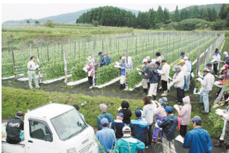
えんどう類現地検討会

JAいぶすき管内の山川地区では、スナップえんどう・実えんどうあわせて農家戸数179戸、栽培面積53ヘクタールを計画しています。