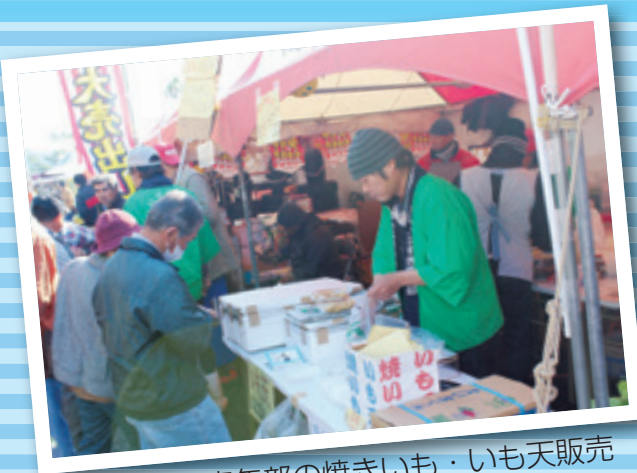
青年部の焼きいも・いも天販売

いぶすき産業まつり実行委員会は12月6・7日の2日間、サンシティホールいぶすきで第29回いぶすき産業まつりを開催しました。