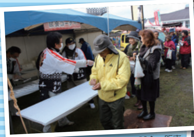
指宿産黒牛の試食・販売