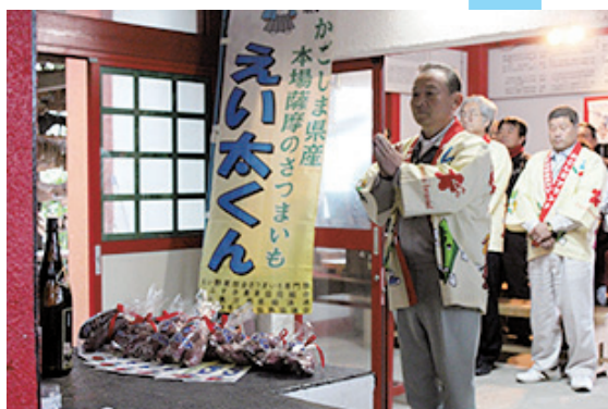
青果用さつまいも「えい太くん」を奉納祈願する関係者

J Aえいさつまいも専門部は12月1日、青果用さつまいも「えい太くん」（品種紅はるか）の本格出荷に向けて、勝負の神様として有名な釜蓋神社（南九州市穎娃町）で奉納祈願を行いました。生産者・J A・関係機関など約30人が出席、2014年産の飛躍を誓いました。「えい太くん」は、品種の特徴である高い甘さを維持するため、収穫から40日間の貯蔵を