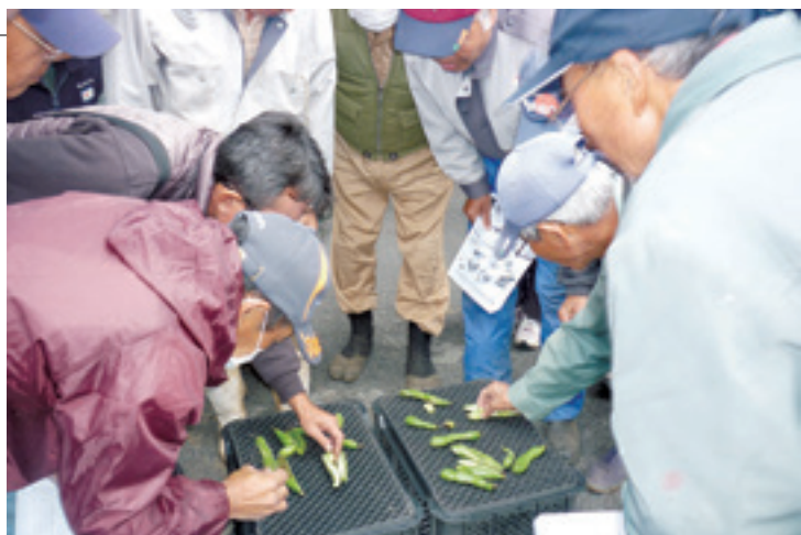
収穫するソラマメの大きさや熟度などを確認する生産者

J Aは12月10日、指宿市山川のJ A小川集荷場で山川地区のそらまめ出荷目揃会を開催、約80人の生産者が参加しました。集出荷要領、出荷基準についてJ Aが説明、県農林水産部農政普及課の職員が今後の肥培管理、病虫害対策などについて説明し、生産者は収穫するそらまめの大きさや熟度などを確認しました。