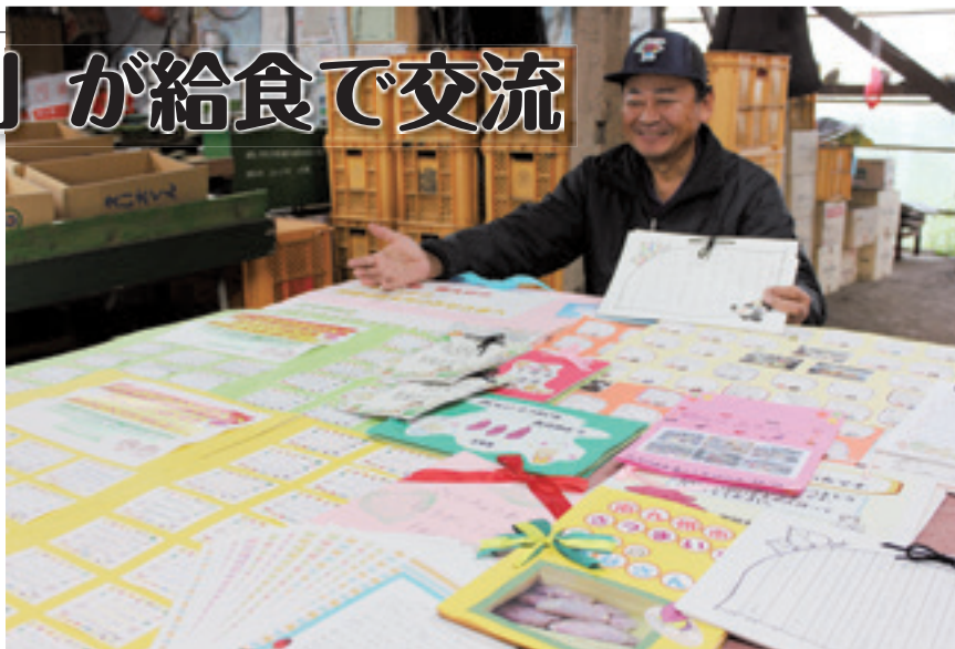
北九州市の児童から送られた手紙に喜ぶ尾曲部会長

J A えいさつまいも 専門部は、福岡県北九州市の小学校（11校）に青果用サツマイモ「えいもちゃん」（品種・紅さつま）4トンを送り、さつま汁などに調理され、給食を食べた児童から感謝の手紙が届きました。手紙には児童一人一人