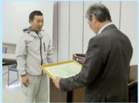
一席を受賞した(有)畠久保牧場