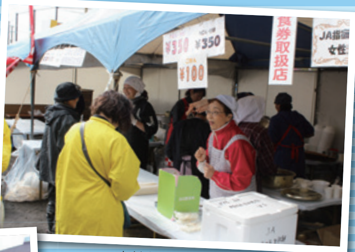
女性部のうどん・そばレストラン