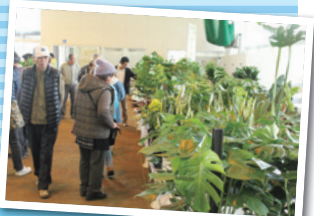
グリーンフェスタいぶすき